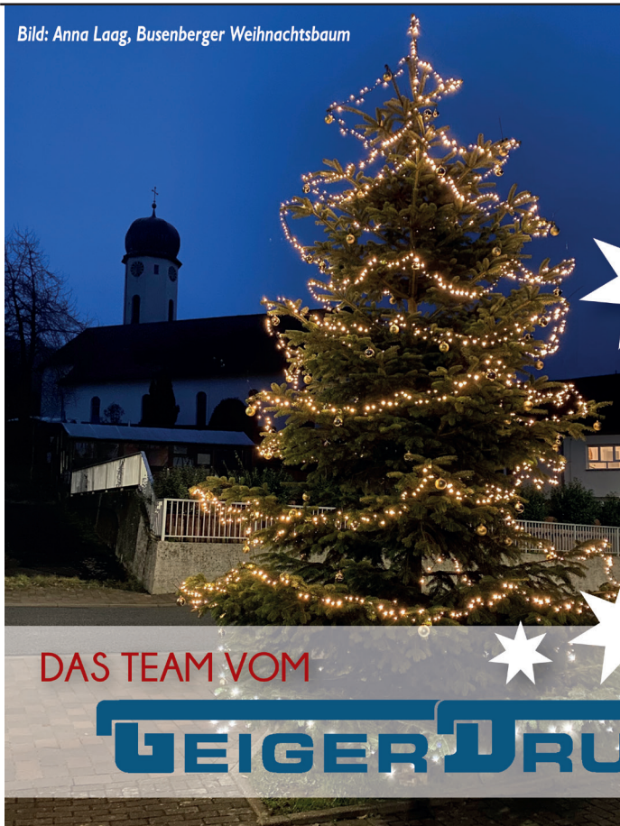
Busenberger Weihnachtsbaum

Wir wünschen Ihnen und Ihrer Familie erholsame und besinnliche Weihnachten, einen entspannten Jahresausklang und ein gesundes und erfolgreiches Jahr 2026.